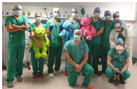
Les P'tits Doudous Catalans

Par ailleurs, le recyclage de certains métaux des instruments du bloc opératoire permet à l'association Les P'tits Doudous Catalans de financer des projets pour améliorer les conditions de prise en charge des enfants devant être opérés et rendre ludique leur parcours de soins. Une action portée par les personnels du bloc investis dans cette noble cause.