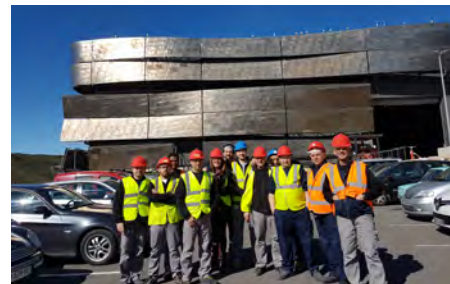
L'équipe CHP Tri des Déchets à l'usine de Calce

Toutefois, le CHP se veut ambitieux et projette une réduction de 15% de sa consommation en énergie. Le contrat de performance énergétique mis en place sur le chauffage, la climatisation, la ventilation et l'électricité s'inscrit pleinement dans les objectifs de mise en conformité avec la réglementation, offre de bonnes conditions de travail et d'accueil pour les personnels et les usagers tout en luttant contre le gaspillage et en réalisant des économies. Un vrai atout pour notre démarche RSE. ■