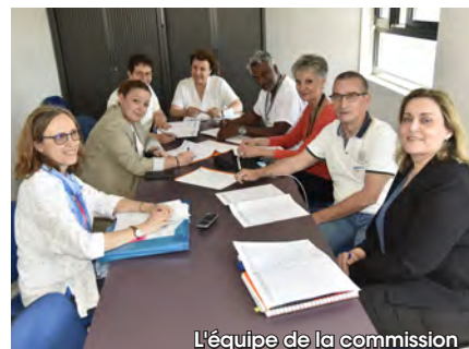
L'équipe de la commission

La médecine de prévention, la psychologue du travail, l'assistante sociale du personnel, les préventeurs et ergonomes, la référente handicap, la direction des soins et la DRH constituent la commission pour une prise de décision collégiale garantissant l'équité des mesures décidées.