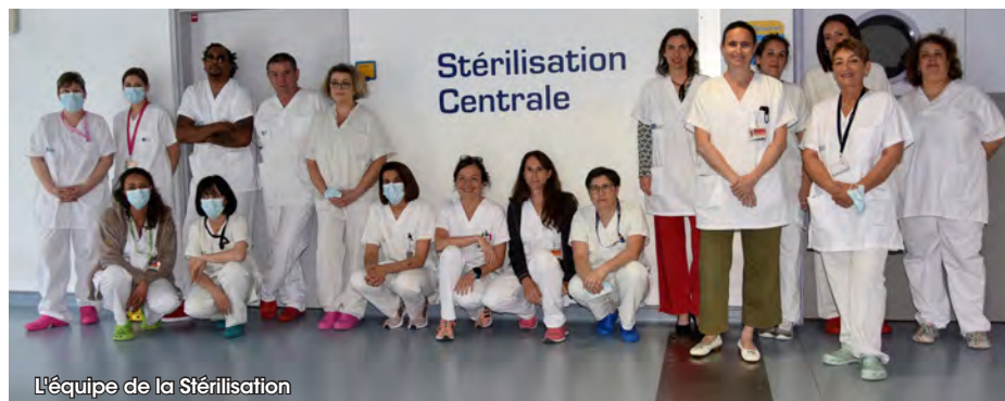
L'équipe de la Stérilisation